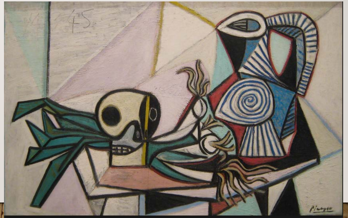
Pablo Picasso, Stilleven met doodskop, prei en kan , 1945