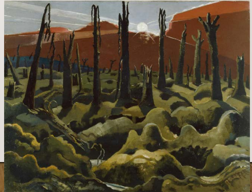
Paul Nash, We Are Making a New World (1918)