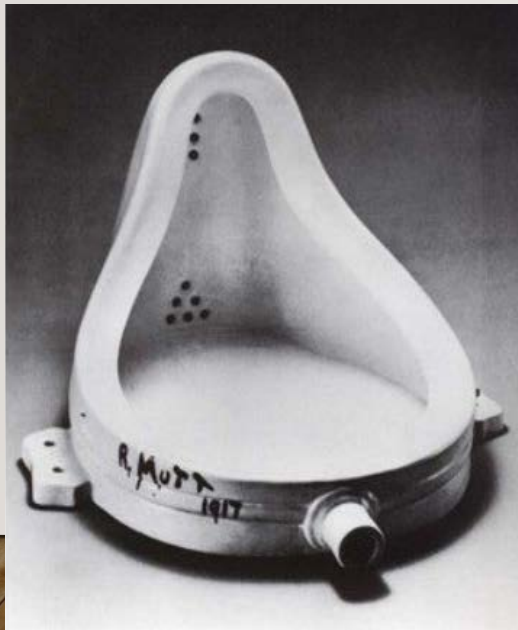
Marcel Duchamp, The fountain (1917)